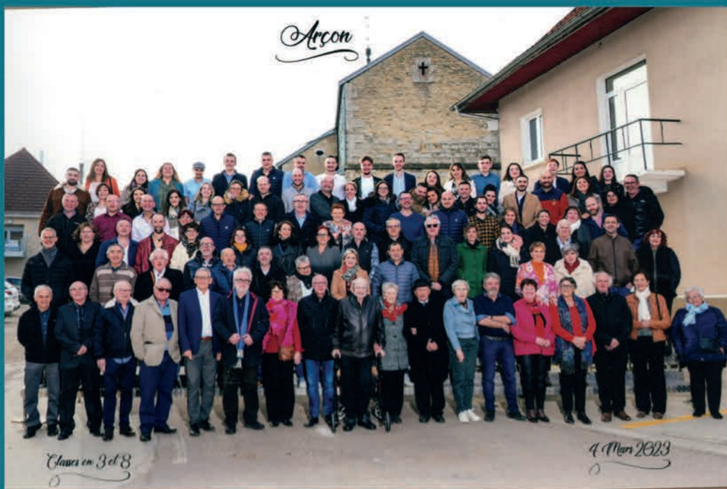
A l'année prochaine et n'oubliez pas la date du 1er samedi de mars pour les prochains conscrits.

C'est sous un soleil de printemps que 97 conscrites et conscrits de 20 à 90 ans, ont eu plaisir de fêter, à la salle des fêtes d'Arçon, les habituelles retrouvailles d'enfance pour la plupart.